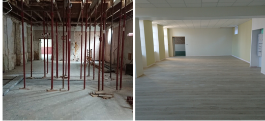
Juillet 2019 début de la rénovation de «la maison des sœurs» - Janvier 2020 la nouvelle cantine peut accueillir les enfants.

parfois très fragilisées par le premier confinement, en prenant en charge une partie des fournitures scolaires (crayons, gommes et colles).