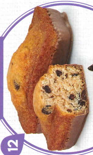
CHOCOPÉPITES & CHOCOLAIT 20 emballages individuels - 570 g DDM* : 2 mois