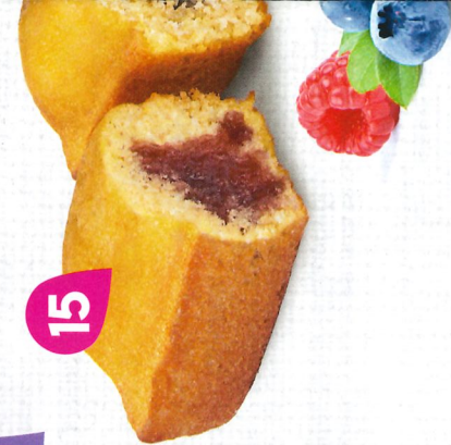
PANACH 30 emballages in DDM* : 10 Mirabelle - 10 Myrtille

Sans huile de palme Sauf Cigarettes Chocolait, Noisettes