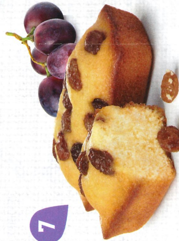
CAKES RAISINS 30 emballages individuels - 900 g DDM* : 2 mois