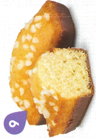
GÉNOIS CHOCOLAIT 30 emballages individuels - 920 g DDM* : 2 mois