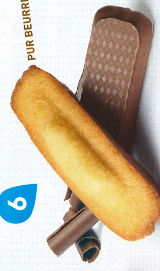
LONGUES CHOCOLAIT 20 étuis de 2 - 600 g DDM* : 2 mois