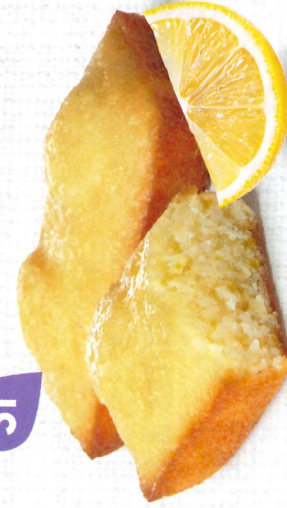
FONDANTS CITRON 30 emballages individuels - 660 g DDM* : 2 mois