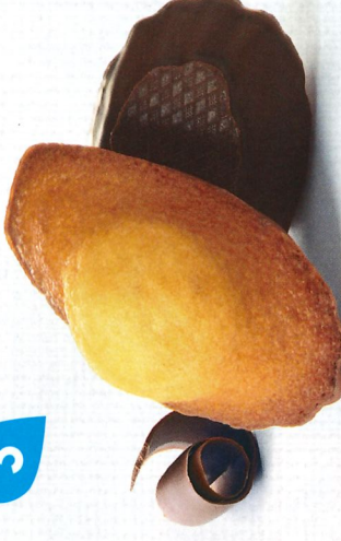
MADELEINES CHOCONOÏR 50 emballages individuels - 1080 g DDM* : 2 mois