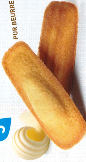
LONGUES NATURE 20 étuis de 2 - 490 g DDM* : 2 mois