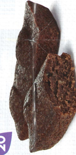
MOELLEUX AU CHOCOLAT 30 emballages individuels - 660 g DDM* : 2 mois