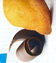
MADELEINETT 3 sachets de 100g de DDM* : 2 mois