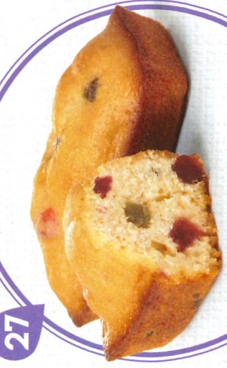
CAKES AUX FRUITS 20 emballages individuels - 600 g DDM* : 2 mois