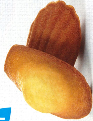
MADELEINES NATURE 50 emballages individuels - 880 g DDM* : 2 mois