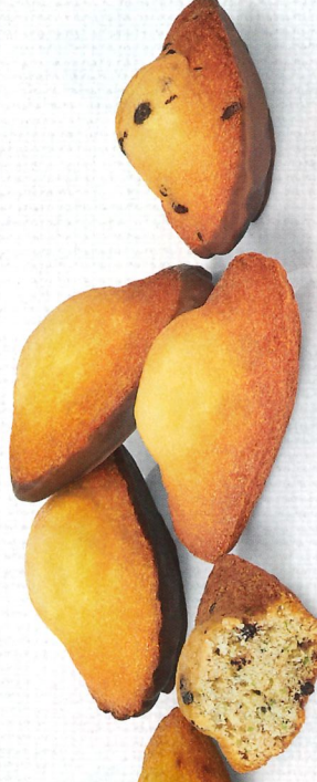
FARANDOLE DE MADELEINES 30 emballages individuels - 590 g - 5 Madeleines Nature - 5 Madeleines ChocoPistache - 5 Madeleines ChocoLait - 5 Madeleines DoubleChoc - 5 Madeleines Citron DDM* : 2 mois