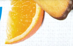
LONGUES CHOCOLAIT 20 étuis de 2 - 600 g DDM* : 2 mois