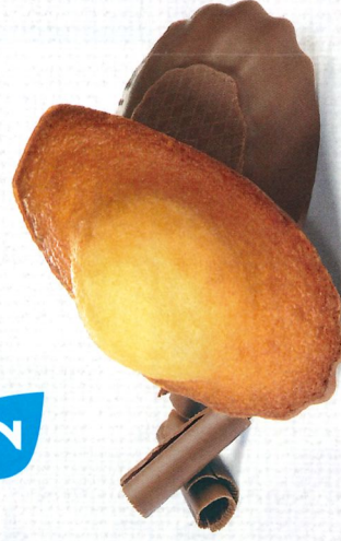
MADELEINES CHOCOLAIT 50 emballages individuels - 1080 g DDM* : 2 mois