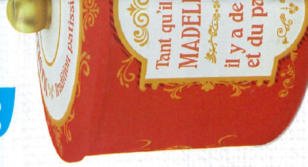
BOÎTE COC MADELEINES 12 emballages in DDM* :