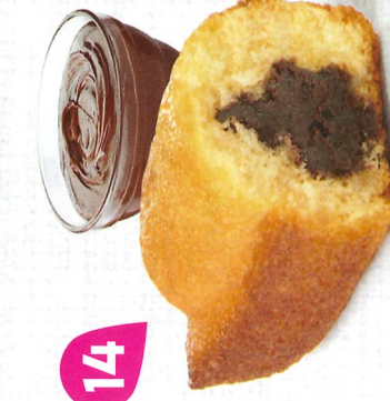
BIJOU CACAO 20 emballages individuels - 660 g DDM* : 2 mois