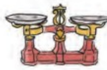
Balance de Roberval