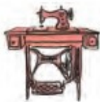
Machine à coudre