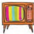
Télévision en couleurs