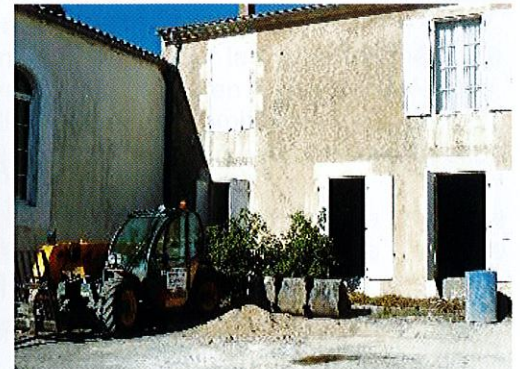
Achèvement de ces travaux fin décembre