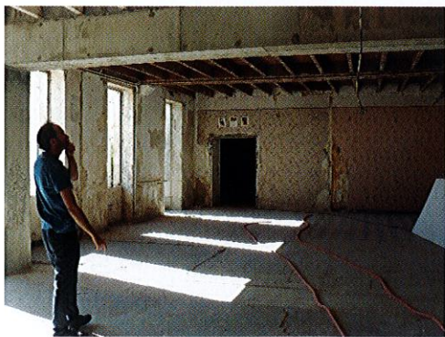
Nouveau restaurant scolaire

Pour les extérieurs : la couverture de la chapelle refaite à neuf. La cour remise à niveau suite à la suppression des arbres qui ont déformé le revêtement existant et pour assurer l'accessibilité des classes.