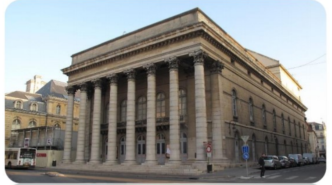
Le Grand-Théâtre de Dijon

En ville, on a facilement accès à la culture : on trouve des bibliothèques et des médiathèques, des cinémas, des musées, des théâtres, des salles de spectacle... Certains de ces équipements occupent de beaux bâtiments historiques , d'autres ont été construits récemment et se trouvent dans des bâtiments modernes . En effet, les loisirs occupent une place croissante dans la vie quotidienne et l'on construit sans cesse de nouveaux équipements.