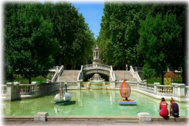
Le jardin Darcy, à Dijon

En ville, on trouve de nombreux espaces dédiés aux jeux et à la détente : des jardins publics, des parcs, des aires de jeux pour les petits, des terrains de jeux sur lesquels les plus grands peuvent courir après un ballon, faire du roller, ... On trouve aussi de véritables équipements sportifs , pour les jeunes et les adultes, les amateurs et les professionnels : des terrains de sport, des stades, des gymnases, des piscines, des patinoires, ... .