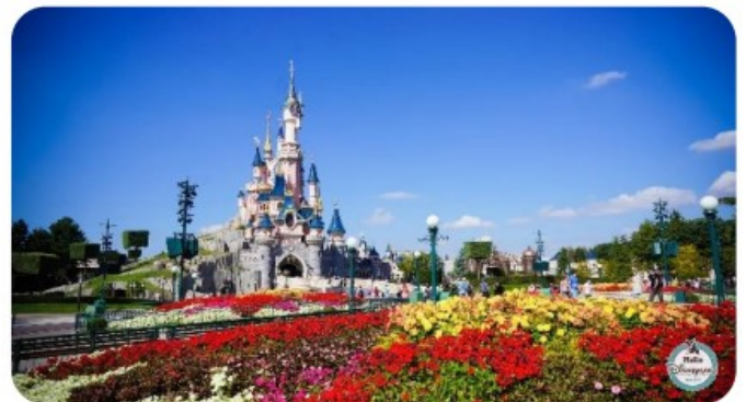
Le parc d'attractions Disneyland Paris

Dans certaines villes, on trouve d'anciens zoos, des aquariums , installés là depuis longtemps. Faute de place en ville, on construit désormais ces équipements à la périphérie des villes . On y installe également les parcs d'attraction : loin du centre-ville mais pas trop de la ville et près des axes de circulation , de façon que les citadins viennent facilement. .